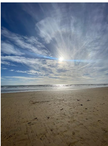
Das Wochenende verbrachten die Schüler*innen in ihren Gastfamilien.