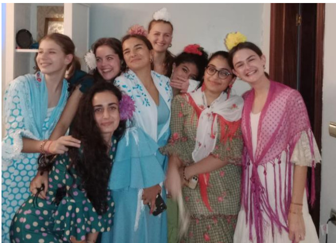
Ein Eintauchen in die eng mit Andalusien verbundene Tradition des Flamencos auf der Plaza de España und – bei der Anprobe bei einer der Austauschschülerinnen zuhause.